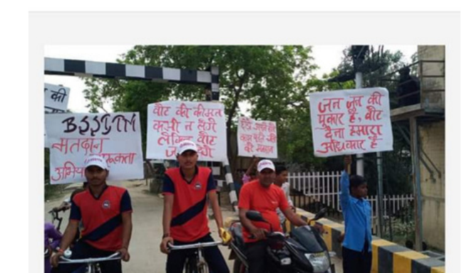
इंजीनियरिंग कालेज के छात्रों ने